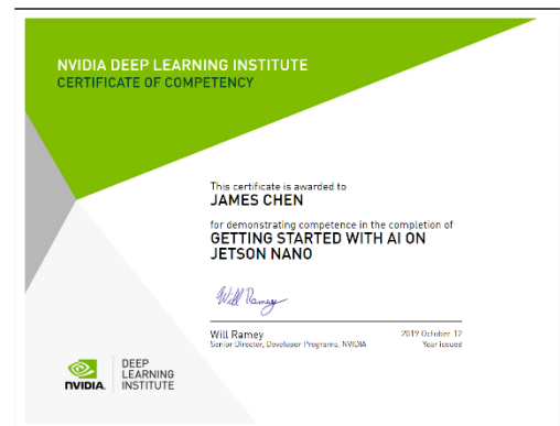
NVIDIA Jetson Nano 電子證書

註: 若缺乏基礎程式觀念先備知識，建議於開課前可先觀看【均一教育平台】程式語言課程影片學習 https://www.junyiacademy.org/computing/programming/python?fbclid=IwAR3l0Gf9fRp2idsO_pln5iRQNBGZxeR2dfJJ9E6jmy9Ib2QcGQt2rh6t86o